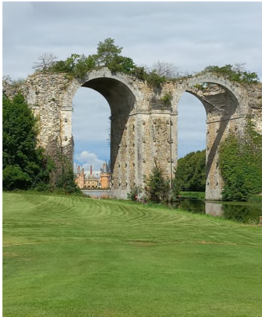
golf de Maintenon